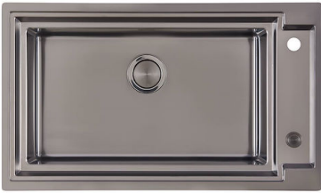
OUTLINE H25 - GUN METAL 6625 006